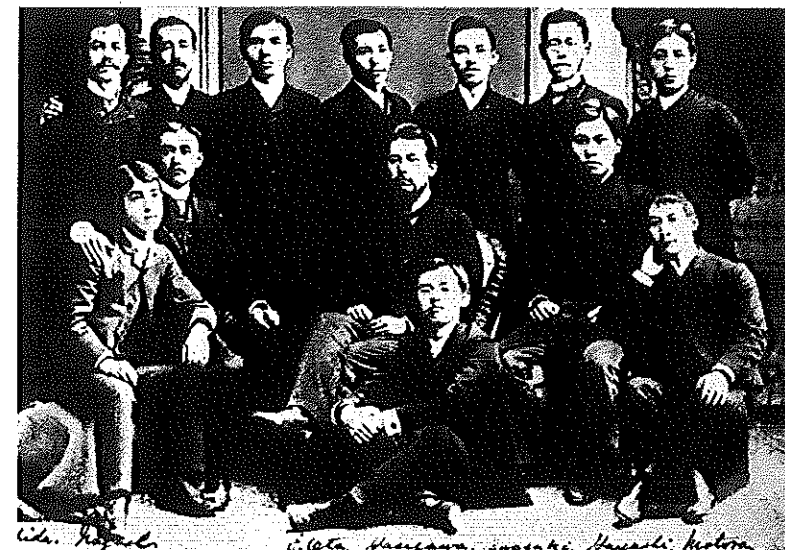
図3 米国留学生と久彌