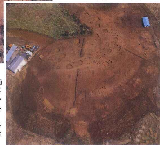
↓ 図3 小さな村 佐倉市六拾部遺跡