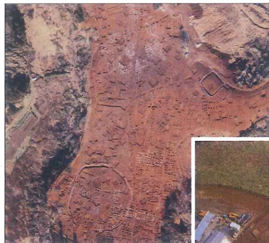
← 図2 大きな村 佐倉市高岡遺跡

このような社会情勢を背景として、千葉県独自とも言える様々な文化が生まれ、特に信仰に関する遺物が数多く発掘されています。