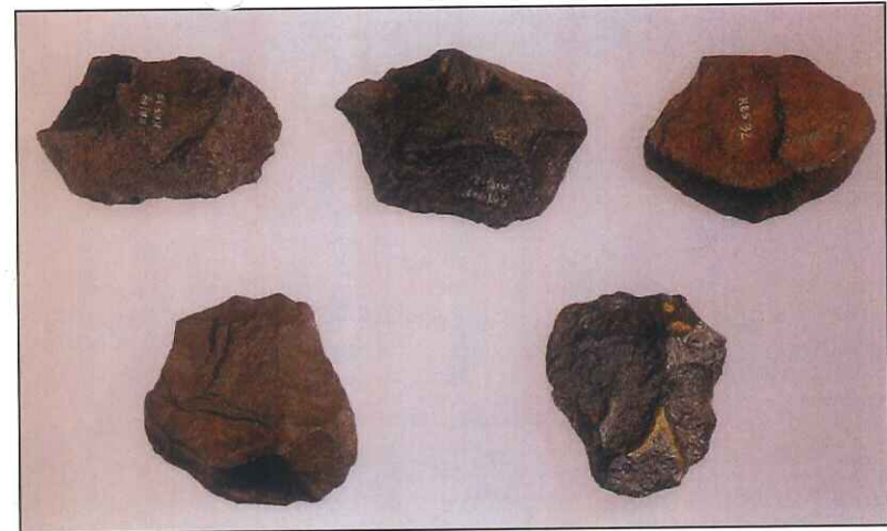
図2 オールドヴァイ文化の石器群（ケニア）【左上の石器の大きさ長さ約7.3cm】

日本の旧石器時代は2つの時期に区分されて研究され、それぞれ前期・後期旧石器時代と呼ばれています。ただ、前期については現在研究が白紙に戻されたため3万年前から1万2000年前までの後期旧石器時代の遺跡のみが、日本の旧石器時代遺跡として確実に存在していたことがあらためて確認されています。