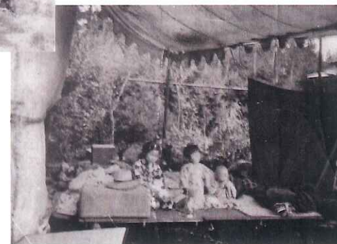
図4 大正12年 関東大震災後のテント生活