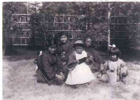
図3 官舎の庭で(撮影年月日不明)