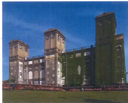
図4 横浜根岸競馬場一等観覧席（現根岸競馬記念公苑馬の博物館）