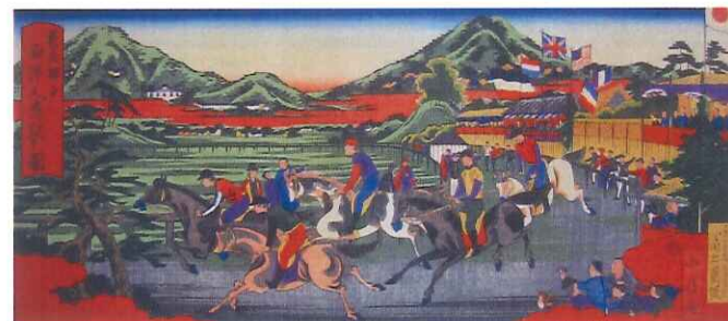
図3 摂州神戸西洋人馬駆之図（明治初期）