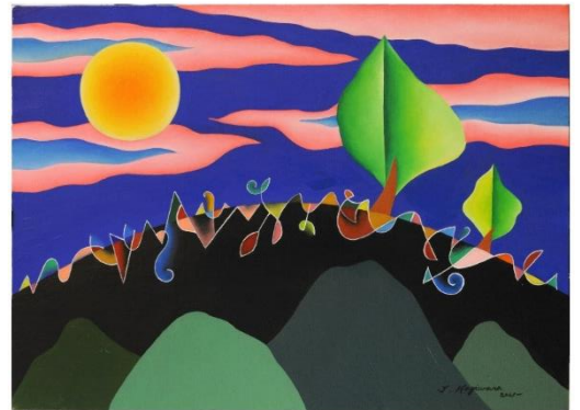
タイトル「ロマンティックな夜」 F30号

1951年千葉県佐原市(現香取市)に生まれる。 18歳の時に画壇にデビュー。 以来世界各国で受賞を重ね、その数は120にも及ぶ。