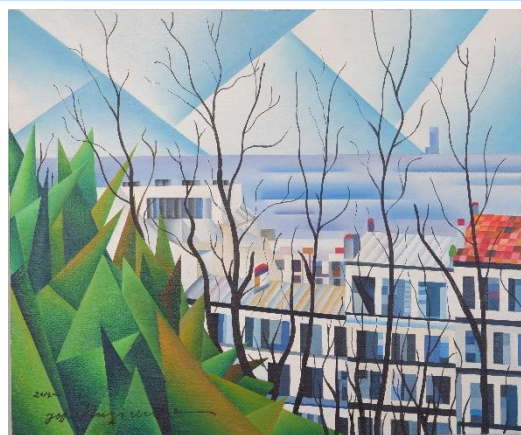
タイトル「モンマルトルの丘」F20号