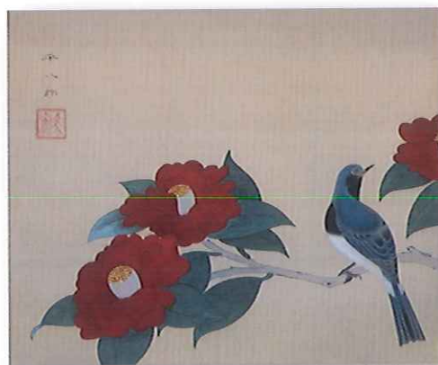
福田平八郎《椿大瑠璃》

<お問合せ> 富里市立図書館 〒286-0221 千葉県富里市七栄653-1 TEL.0476-90-4646