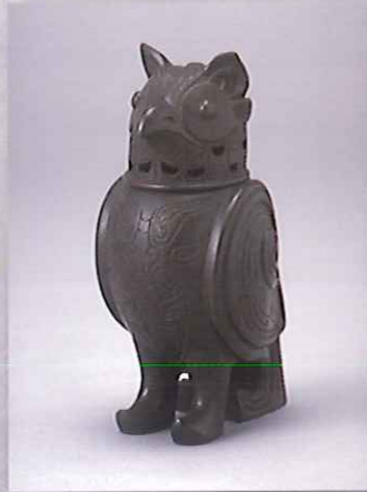
香取秀真《美々豆久香爐》